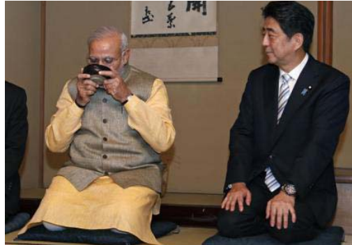
↑お茶会の様子。正座するモディ首相に安倍首相が氣遣ったところ「ヨガをやっているから大丈夫だ！」と返したそう。